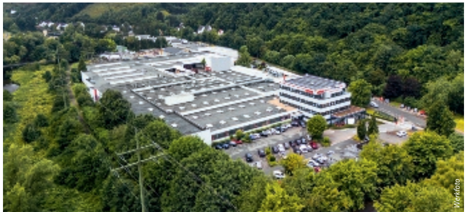
Der Standort Finnentrop ist das operative und strategische Zentrum der Unternehmensgruppe.

Die Heinrich Eibach GmbH blickt 2026 auf ihr 75-jähriges Bestehen. Seit der Gründung hat sich das Unternehmen von einem regionalen Familienbetrieb zu einem international tätigen Akteur im Bereich Feder- und Fahrwerkskomponenten entwickelt. Eibach ist in mehreren Geschäftsfeldern tätig. Im Sektor der Erstausrüstung arbeitet das Unternehmen mit ausgewählten OEM-Kunden zusammen. Daneben ist Eibach im Aftermarket mit fahrzeugspezifischen Produktlösungen vertreten. Ergänzt wird das Portfolio durch die Industriesparte, die technische Federn und Komponenten auf höchstem Niveau für Anwendungen außerhalb der Automobilindustrie entwickelt und produziert. Heute verfügt Eibach über Produktionsstandorte in Deutschland, den USA und China sowie Engineering- und Vertriebsseinheiten in weiteren internationalen Märkten. Das Unternehmen beschäftigt rund 700 Mitarbeiter und ist mit Partnern in etwa 80 Ländern weltweit aktiv. Der Exportanteil liegt bei rund 70 %. Der Standort