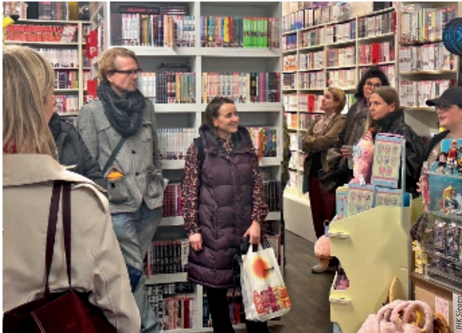
Der erste „Stadtspaziergang“ bot Raum für einen intensiven Austausch der Innenstadtakteure.

Wie steht es um die Siegener Innenstadt? Welche Themen bewegen Händler aktuell – und wo gibt es Potenzial für Verbesserungen? Um diese Fragen ging es beim ersten Stadtspaziergang für Innenstadtakteure der IHK Siegen. Trotz regnerischen Wetters machten sich etwa 20 Teilnehmer auf den Weg durch die Krönchenstadt. Startpunkt war die City-Galerie. Von dort führte die Route bis in die Oberstadt. Mit dabei waren neben Einzelhändlern aus Siegen auch weitere aus anderen Kommunen im Kammerbezirk. Dazu kamen Vertreter des Stadtmarketings Siegen,