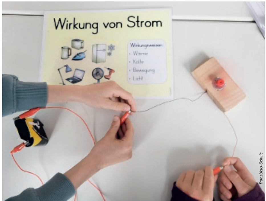
Ein großer Gewinn für die MINT-Bildung in der Franziskus-Schule in Lennestadt-Meggen: die „MINT-Entdeckerwoche“.

Die frühe Förderung von Kompetenzen in den Bereichen Mathematik, Informatik, Naturwissenschaften und Technik (MINT) ist essenziell, um den Nachwuchs für die Anforderungen der digitalen Zukunft fit zu machen. Vor diesem Hintergrund unterstützt die IHK Siegen über ihr Innovationsbudget regelmäßig heimische Schulen, Kindertagesstätten und andere Lernorte, die mit spezifischen Projekten die MINT-Bildung vorantreiben und Kinder für diese Themen begeistern. Allein im Jahr 2025 stellte die Kammer dafür 50.000 € zur Verfügung.