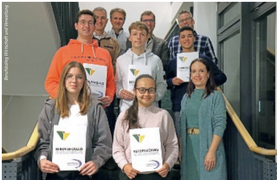
Gewappnet für das Exportgeschäft: erfolgreiche Europa- und Asienkaufleute nach einer zweijährigen Qualifikation. Einige Absolventen waren bei der Verleihung verhindert.