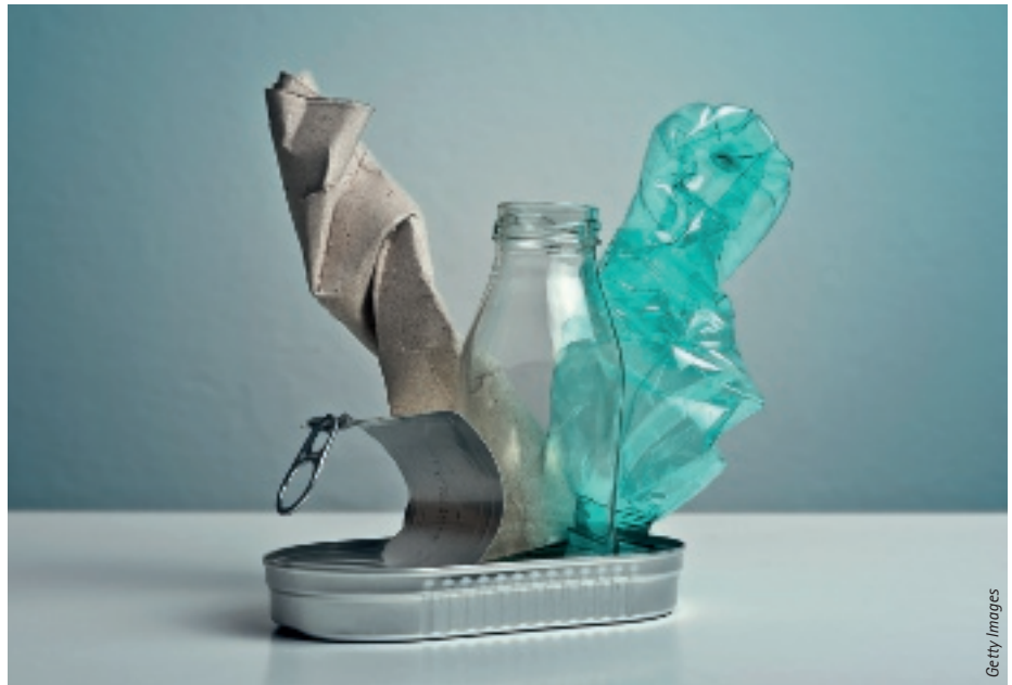
Die neue europäische Verpackungsverordnung bringt weitreichende Veränderungen mit sich – zum Teil bereits ab August 2026.

Während viele langfristige Anforderungen – etwa zur Recyclingfähigkeit oder zu Rezyklatanteilen – erst in den 2030er Jahren greifen, werden einige Pflichten bereits ab August 2026