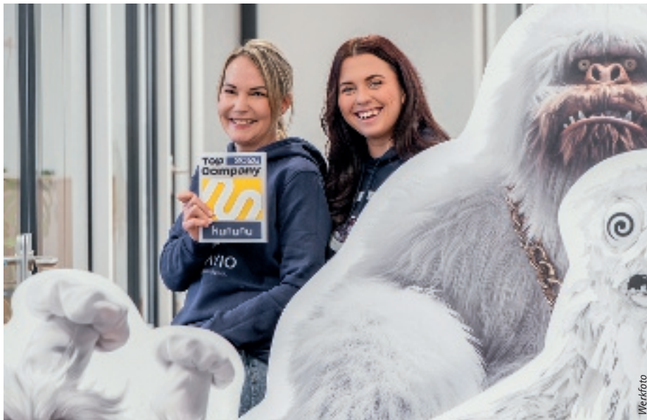
Die Verantwortlichen der ontavio GmbH freuen sich über die erneute Auszeichnung.

Die ontavio GmbH aus Lennestadt wurde von der Arbeitgeber-Bewertungsplattform kununu als „Top Company 2026“ ausgezeichnet. Damit gehört ONTAVIO einmal mehr zu den rund 5 % der besten Arbeitgeber Deutschlands, die jährlich dieses exklusive Siegel erhalten. Bereits zum