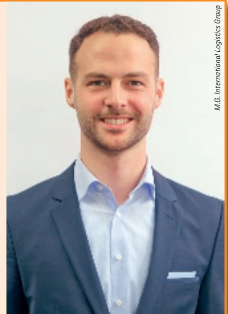
M.G. International Logistics Group

Nein, an dem Punkt sind wir aktuell noch nicht. Aber wir haben es natürlich mit einer potenziellen Langzeitthematik ohne absehbares Ende zu tun. Die Folgekosten kommen erst noch auf die Unternehmen zu. Aktuell erreichen viele Lieferungen nach und nach die Golfregion. An verschiedenen Häfen wird entladen. Dann beginnt die eigentliche Arbeit: alternative Lösungen für