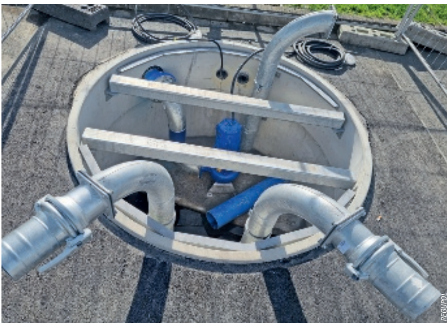
Zum Aktionsplan der Firma REGUPOL gehört unter anderem ein Pumpensumpf, der bei Starkregen zum Einsatz kommt und große Schäden verhindert.