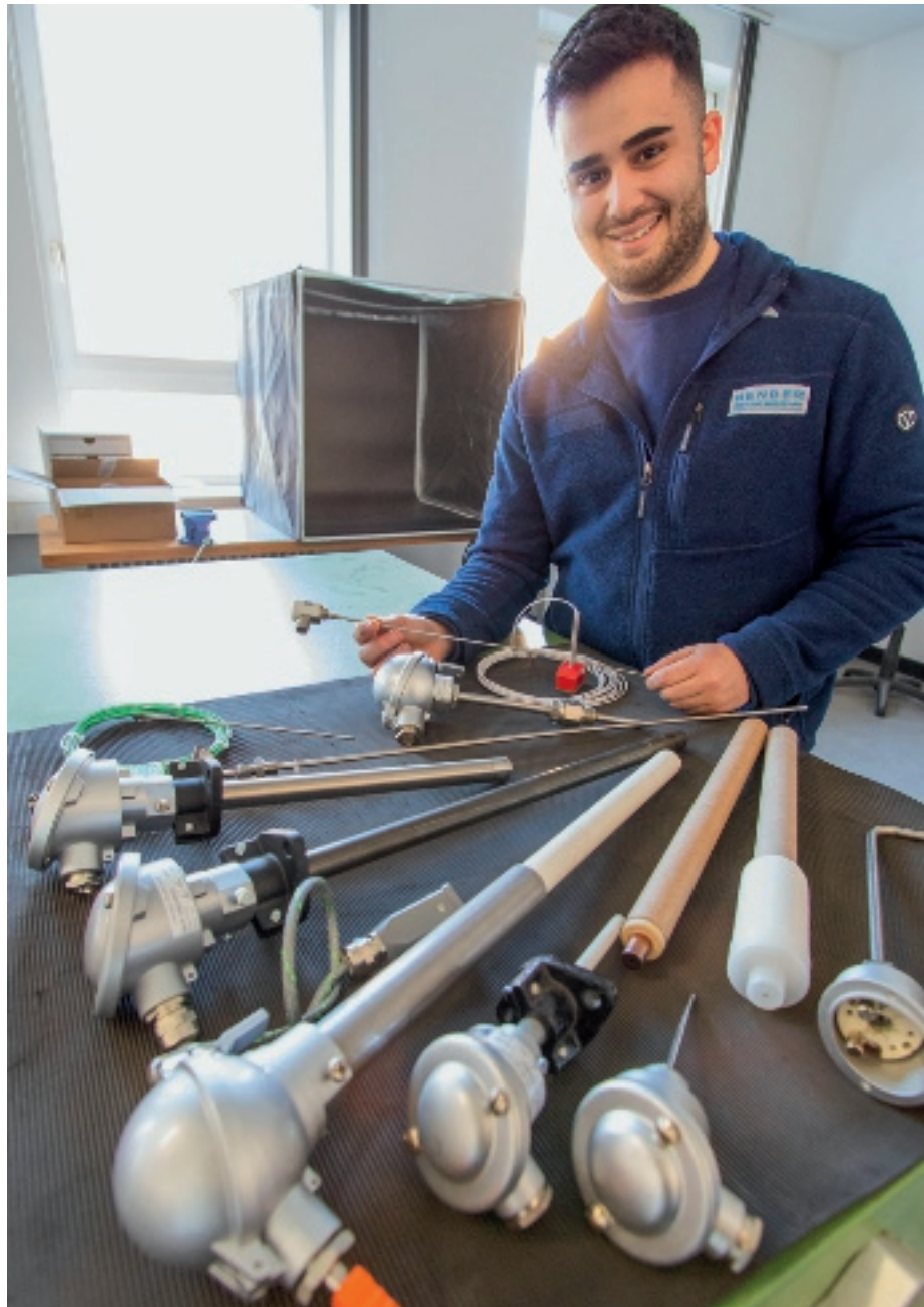
Ein Mitarbeiter kontrolliert verschiedene Thermolemente.

Ein weiterer Schwerpunkt liegt im Unternehmensbereich „Service“. Dazu zählen Werks- und Vor-Ort-Kalibrierungen, bei denen Messgeräte umfassend geprüft und die Ergebnisse dokumentiert werden. Die Techniker führen unter anderem INST-, SAT- und TUS-Prüfungen durch – Systemgenauigkeits- und Homogenitätsmessungen, die eine laufende Produktion möglichst wenig beeinträchtigen und Zeit sowie Transportkosten sparen. Darüber hinaus bietet BENDER Schulungen, Implementierungen und Audits zu relevanten Normen an. Durch die Kooperation mit einem Ofenbauer übernimmt das Unternehmen auch Wartungsarbeiten. „Wir wollen Problemlöser sein“, sagt der Geschäftsführer. „Unsere Kunden sollen sich darauf verlassen können, dass wir uns um alles kümmern.“