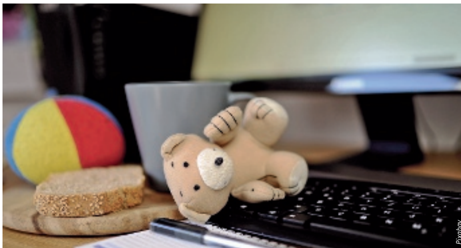
Familienfreundlichkeit ist ein wichtiger Erfolgsfaktor für Unternehmen.

Vereinbarkeit von Familie und Beruf ist eine der zentralen Herausforderungen der modernen Arbeitswelt. 19 Betriebe aus Siegen-Wittgenstein und Olpe, die es ihren Mitarbeitern ermöglichen, berufliche Verpflichtungen besser mit ihrer familiären Verantwortung in Einklang zu bringen, haben jetzt das Zertifikat „Familienfreundliches Unternehmen“ erstmals oder erneut erhalten.