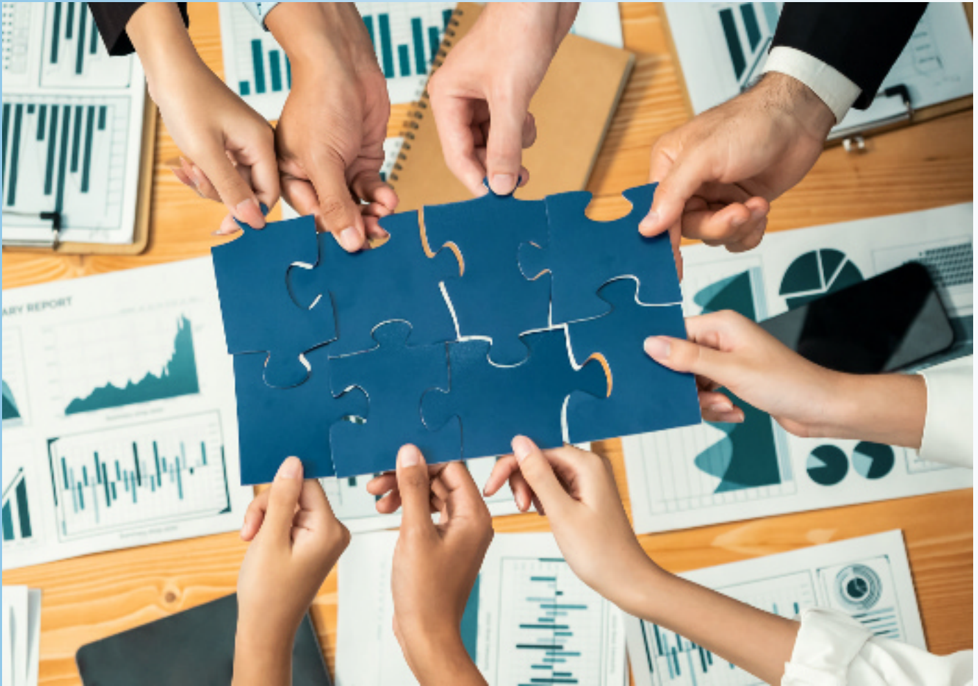
Mehrere Gesellschaften zusammenfügen unter dem Dach einer Holding – das kann sich lohnen: Um Synergien in der Verwaltung zu nutzen, um Gewinne und Verlust miteinander zu verrechnen oder um die Holding als Spardose für unternehmerische Investitionen zu nutzen.