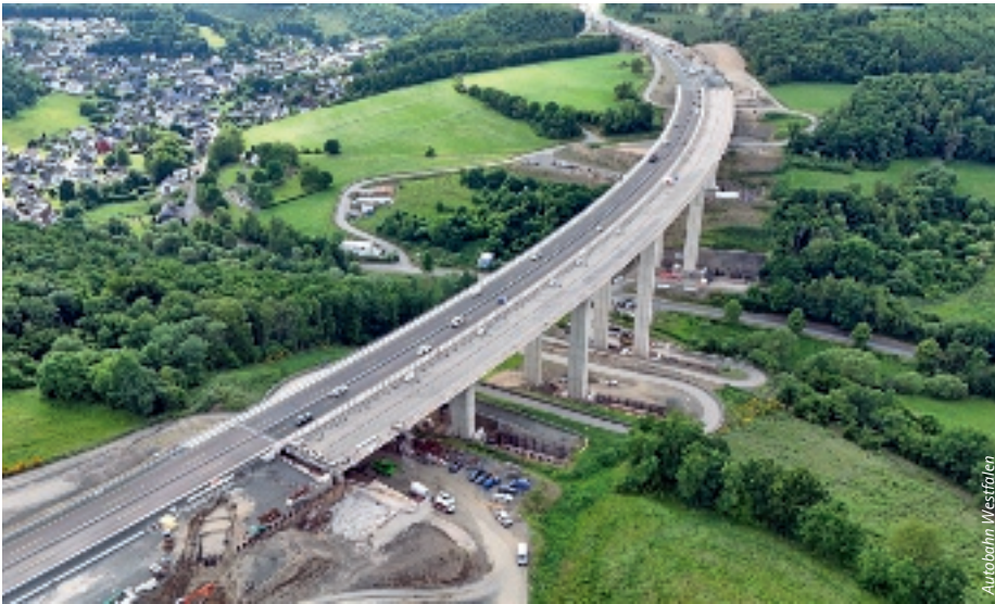
Der Querverschub des 70 Meter hohen Teilbauwerks der Talbrücke Rinsdorf inklusive der Pfeiler war ein technisches Novum in Deutschland.

Zwischen den Anschlussstellen Siegen-Süd und Wilnsdorf sind die Talbrücken Rinsdorf, Rältsbach und Eisern vollständig erneuert. Die A45 ist in diesem Bereich seit Ende März wieder uneingeschränkt befahrbar. Alle drei Bauwerke wurden in den vergangenen Jahren nahezu parallel neu errichtet. Besonders die Arbeiten an der Talbrücke Rinsdorf hatten bundesweit Aufmerksamkeit erzeugt: Der Querverschub des 70 Meter hohen Teilbauwerks inklusive der Pfeiler war