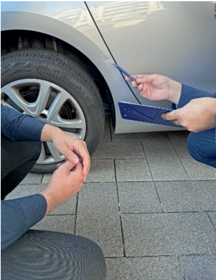
Öffentlich bestellte und vereidigte Sachverständige kommen in zahlreichen technischen und wirtschaftlichen Fragen zum Einsatz.

Soll ein Bauschaden festgestellt, ein Grundstück bewertet, ein Unfallschaden beurteilt oder die Fehlerursache bei einer technischen Anlage ermittelt werden, benötigen Gerichte, Behörden, Unternehmer und Verbraucher Sachverständige. Die Industrie- und Handelskammern sowie weitere Bestellungskörperschaften bestellen und vereidigen aufgrund gesetzlichen Auftrags (§ 36 Gewerbeordnung) Sachverständige auf knapp 300 verschiedenen Sachgebieten.