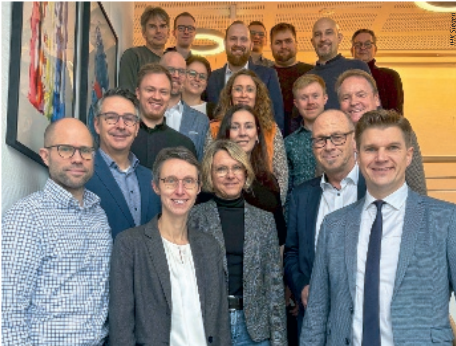
Die Planungsfachleute der beiden Kreise sowie der Städte und Gemeinden tauschten Einschätzungen und Erfahrungen in der IHK Siegen aus.