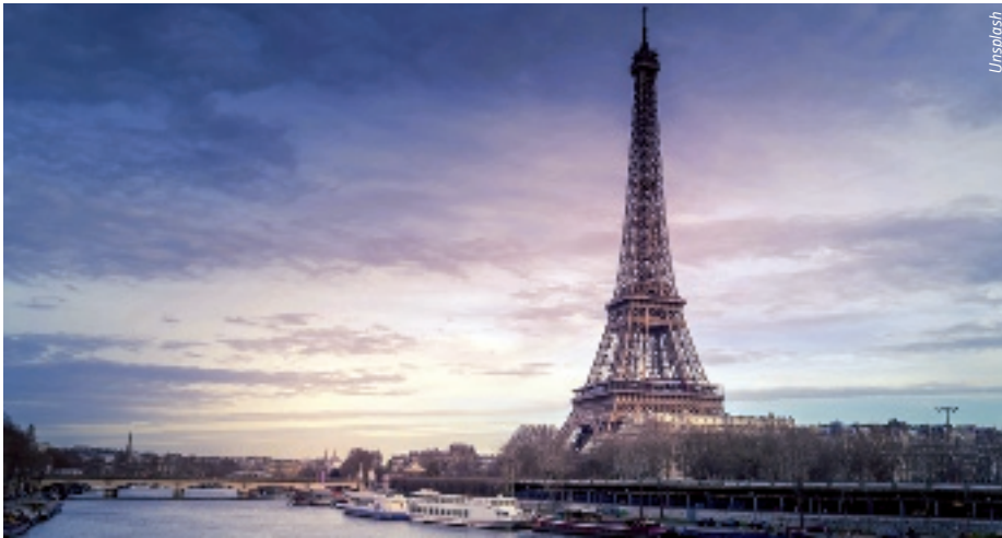
Bei Mitarbeiterentsendungen innerhalb Europas müssen viele Anforderungen bedacht werden.

Mit großem Interesse startete die Webinarreihe „Mitarbeiterentsendung in Europa – Länder im Fokus“. Die Reihe, organisiert im Rahmen von NRW.Europa und dem Enterprise Europe Network gemeinsam mit den nordrhein-westfälischen IHKs, bietet Unternehmen Orientierung zu rechtlichen, steuerlichen und organisatorischen Anforderungen bei Auslandseinsätzen von Beschäftigten.